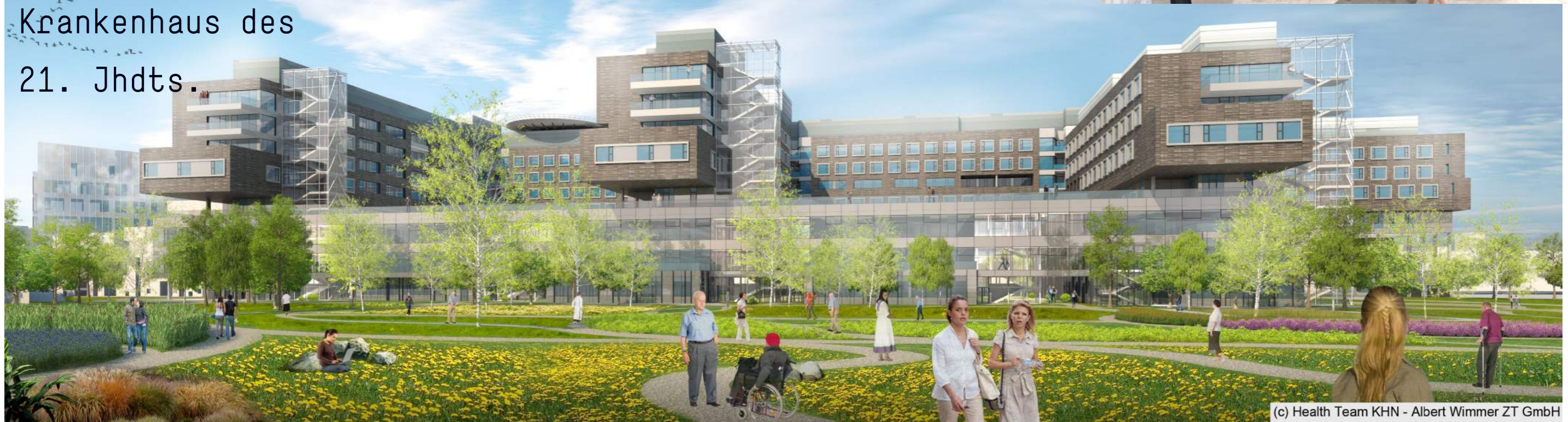
(c) Health Team KHN - Albert Wimmer ZT GmbH